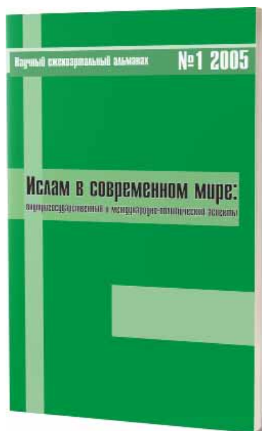
Рис. 1. Обложка первого выпуска журнала «Ислам в современном мире» (№ 1, 2005)