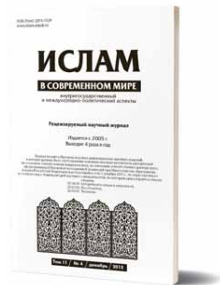
Рис. 3. Обложка журнала «Ислам в современном мире» (2015 г.)

дизайна его макета и обложки (рис. 3), но и в редакционной политике издания в соответствии с международными издательскими стандартами, а также требованиями, предъявляемыми Высшей аттестационной комиссией (ВАК) при Минобрнауки России к такого рода изданиям.