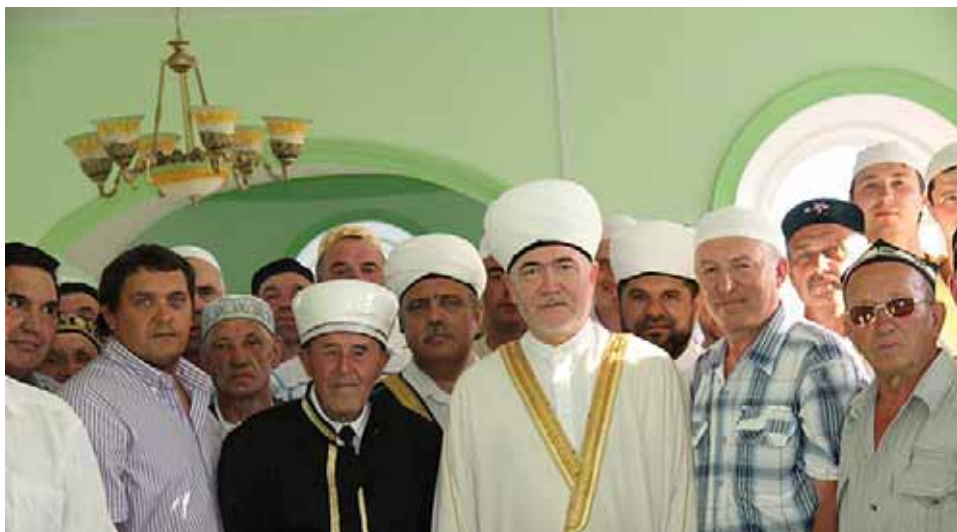
Рис. 5. Муфтий Гайнутдин с имамом Саяром Халилуллиным и прихожанами Соборной мечети Красного Острова. Июль 2011 г.

Данное событие было ознаменовано официальным визитом 15–18 июля 2011 г. делегации Совета муфтиев России и Духовного управления мусульман европейской части России во главе с их председателем муфтием шейхом Равилем Гайнутдином (рис. 5) 1 . Этот визит главы мусульман России стал знаковым событием для всех нижегородцев.