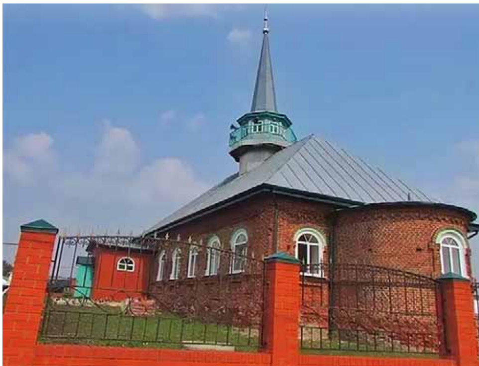
Рис. 1. Соборная мечеть с. Красный Остров, современный вид.

и как многослойный исторический источник, отражающий взаимодействие религиозных институтов, образовательных практик, государственной политики и социокультурных трансформаций на протяжении XIX–XXI веков.